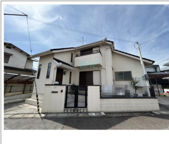
写真 爽やかな青空の下に贅沢なほどに降り注ぐ陽光、豊かな居住性と